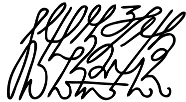
Nom de l'Ange: Blusatviheresvi

5. Pour que les énergies telluriques rétablissent le bien-être émotionnel :