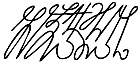
Nom de l'Ange: Kalshba-uresbi