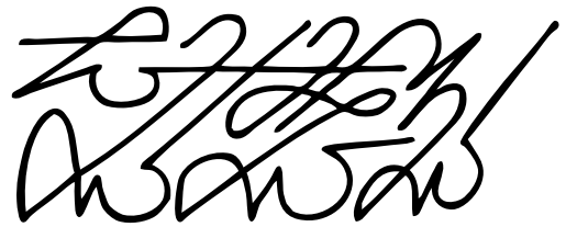
Nom de l'Ange: Kristatvi-heresva

2. Pour que les énergies telluriques nettoient et harmonisent le système chakrique du corps :