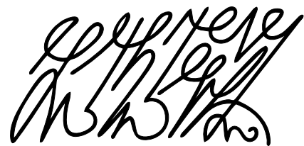
Nom de l'Ange: Baresh-nustrava